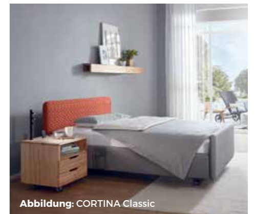
Abbildung: CORTINA Classic

Lebensqualität auf ganz neuem Niveau – für heute, morgen und übermorgen.