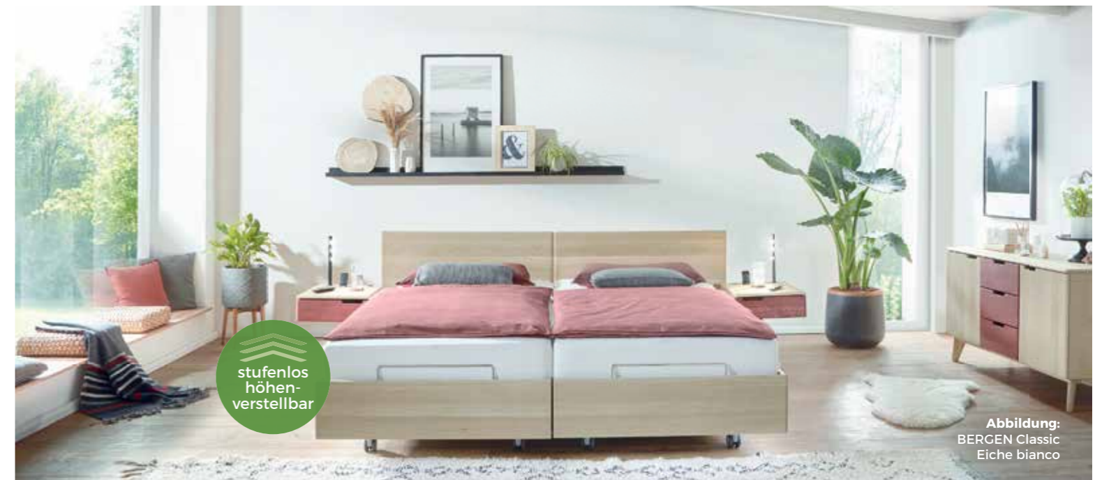
Abbildung: BERGEN Classic Eiche bianco

Neben unserer Erfahrung und aus den Erkenntnissen des Beratungsgesprächs nutzen wir auch unsere computergesteuerte Messtechnik für eine Nackenkissenbedarfsanalyse. Damit erfassen wir alle relevanten Körperdaten. Dies alles zusammen zeigt uns, welches Kissen geeignet wäre. Grundsätzlich empfehlen wir, sofern die Kunden es nicht schon kennen, den Einsatz eines orthopädisch geformten Nackenstützkissens, wie ich es hier in den Händen halte. Diese haben, analog zu unserer Anatomie, eine spezielle Wölbung im Nackenbereich, um den Nacken zu stützen. Und hier diese Vertiefung, um darin dann den Kopf druckfrei zu lagern. Das unterstützt die Atmung und hilft, Verspannungen zu vermeiden.