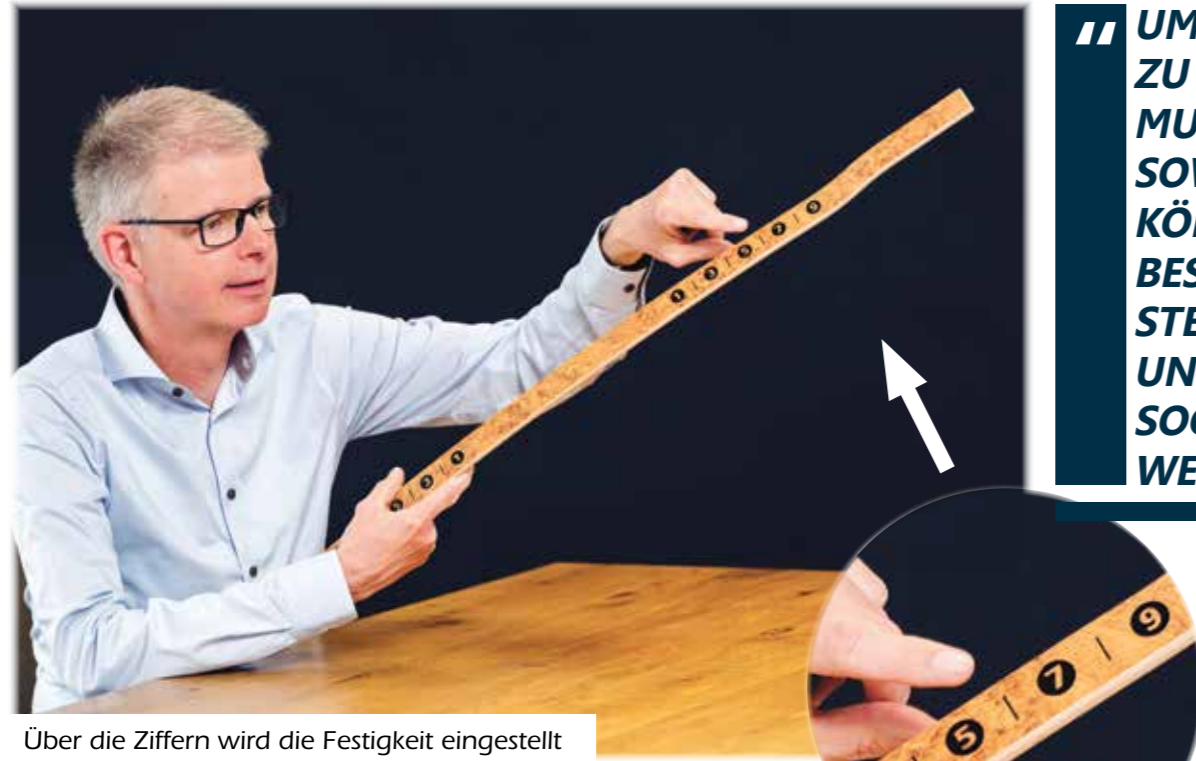
Über die Ziffern wird die Festigkeit eingestellt

Der Kopf hat einen Anteil von circa zwölf Prozent bezogen auf den gesamten Körper. Wie legen wir denn die restlichen 88 Prozent flach?