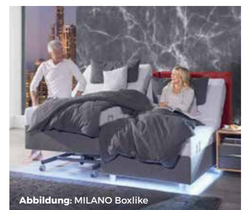
Abbildung: MILANO Boxlike