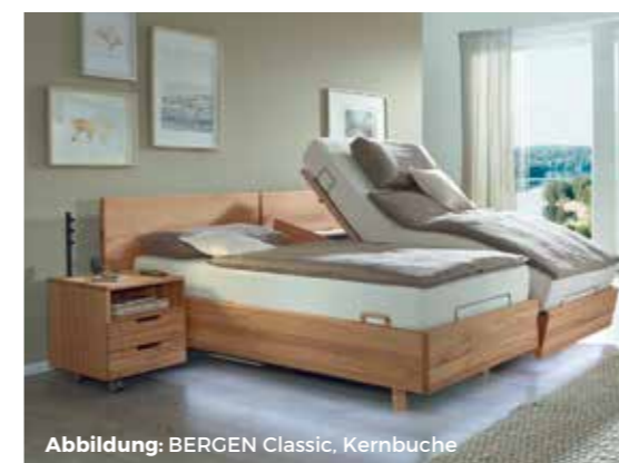
Abbildung: BERGEN Classic, Kernbuche